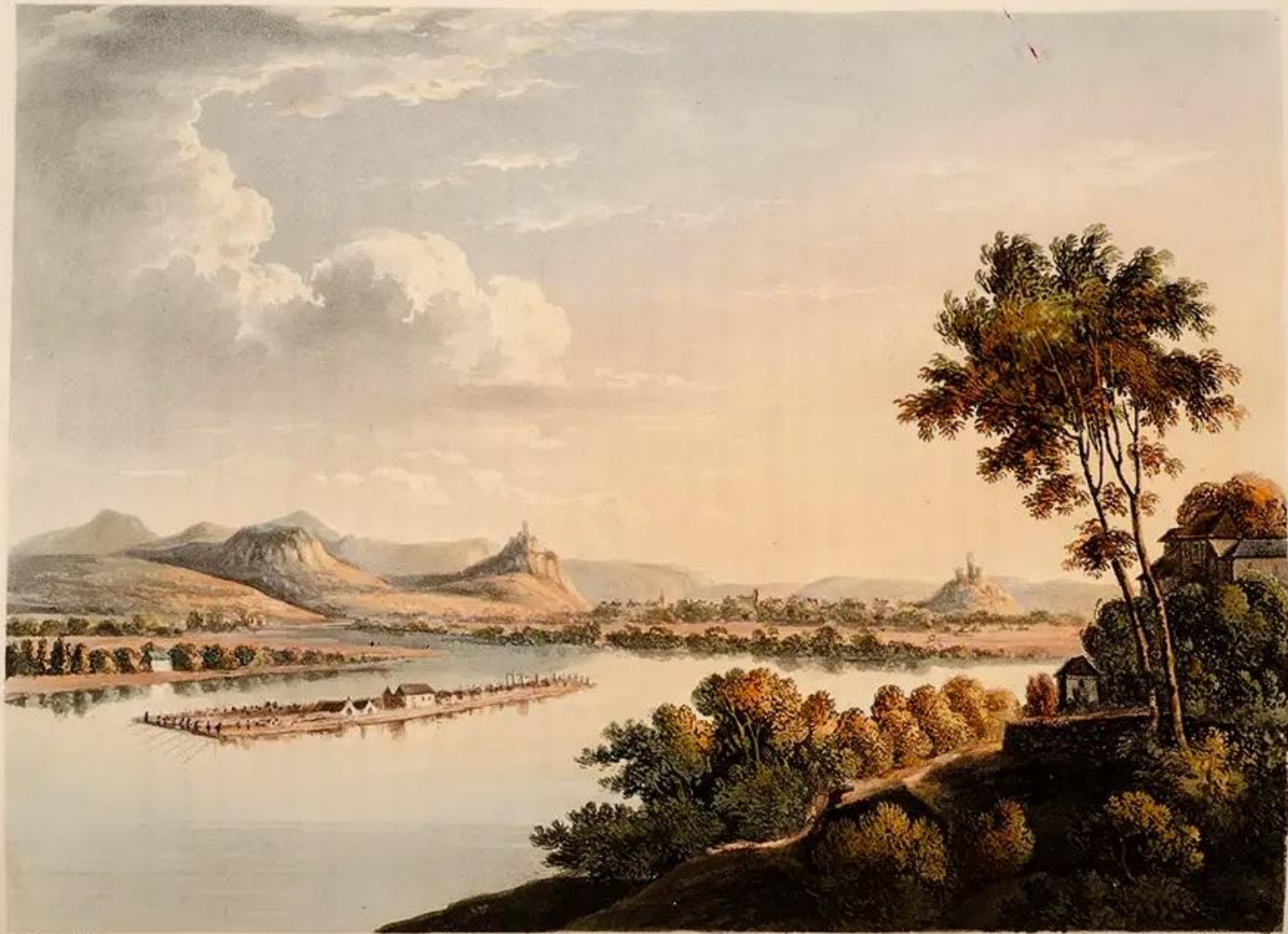
EDDISBURY AND THE SEVEN HILLS.